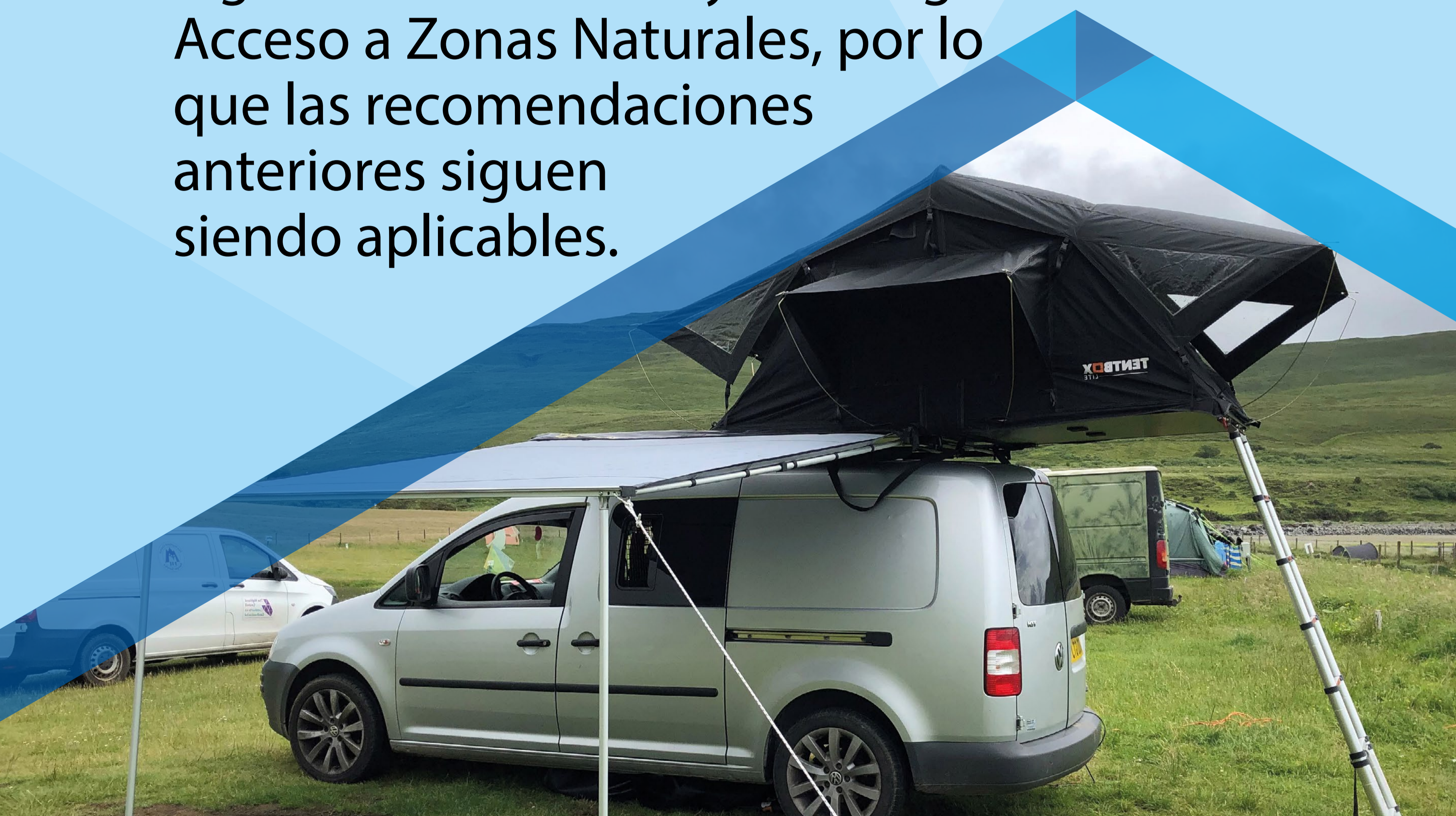
Fotografía de una tienda de campaña de techo por el Ayuntamiento de Highland